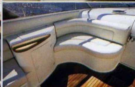
A fianco, il divanetto ad angolo e il mobile bar con frigo e lavello a scomparsa. Sotto, la zona prodiera del pozzetto.